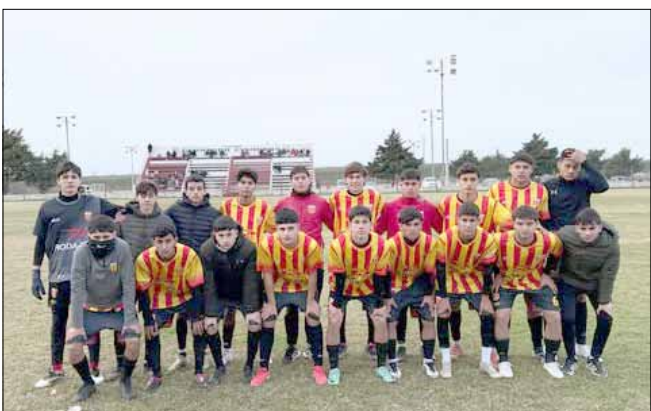
La Quinta división de Bull Dog es uno de los equipos que aseguró su pase a la final por el Apertura.

Sexta división: Balonpié 5 – Empleados 0.