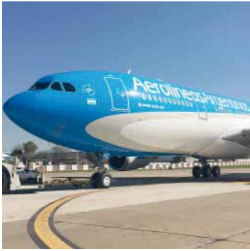
Aerolíneas, reestatizada en el año 2008.

Aerolíneas: resultado económico positivo por $ 169.012 millones