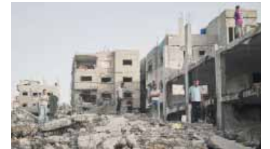
Continúan los ataques.

Hamás asegura que hace consultas por un alto el fuego en la Franja de Gaza