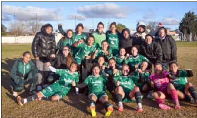
Las "Maestras" pudieron sacar tres puntos importantes como locales.

Con este triunfo, logrado ante el último de la tabla, Sarmiento salió momentáneamente de la zona de descenso y se ubica dentro del grupo de los clasificados al Torneo Reducido con su sexta ubicación en la tabla de posiciones.