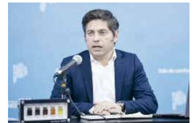
El Gobernador, cara visible de la reestatización.

YPF: Kicillof y el ingreso de los Eskenazi a la compañía