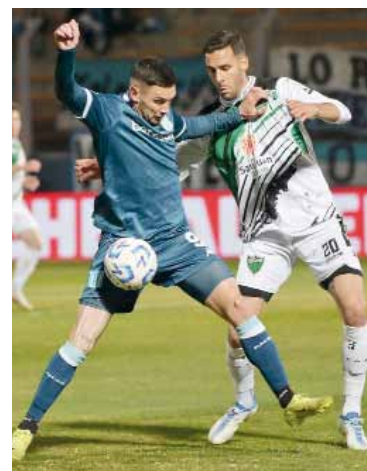
Octavos. En la próxima instancia, la Academia enfrentará a Deportivo Riestra.