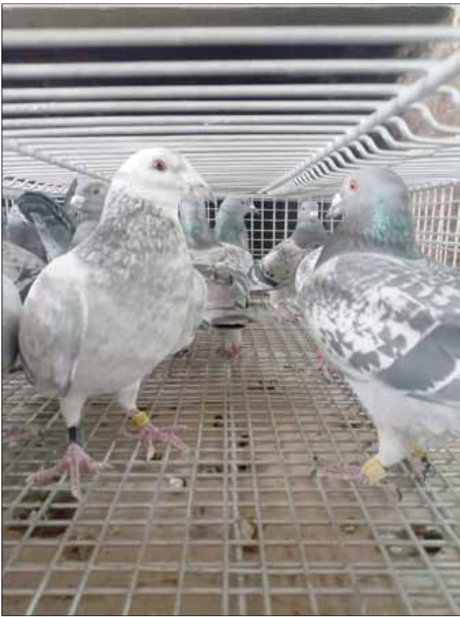
Pupilas que fueron puestas en libertad en Pergamino, para la prueba de velocidad.