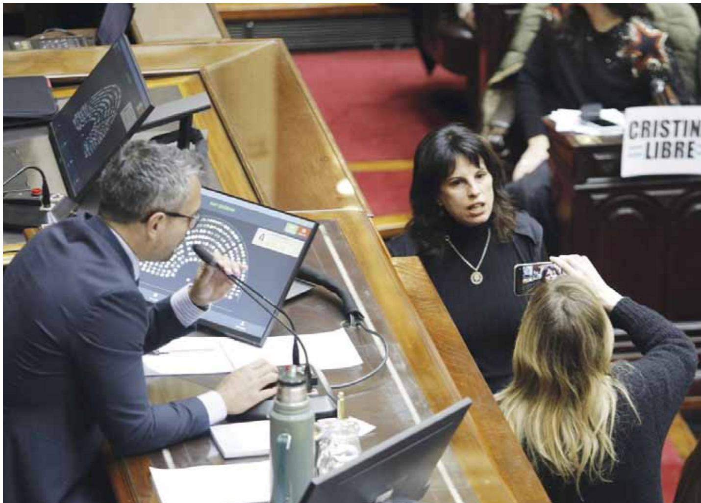
El presidente de la Cámara de Diputados, Martín Menem, trata de llevar calma en una sesión que terminó con los ánimos caldeados.