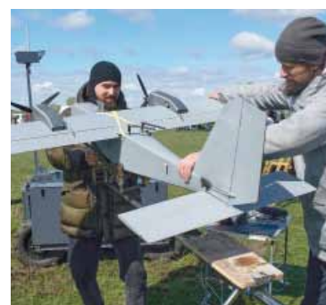
Armas propias. Un dron de fabricación ucraniana en una muestra de innovaciones de defensa para clientes militares.

ocupaciones sobre una caída hasta niveles demasiado bajos de las reservas militares de Estados Unidos, informaron varios medios norteamericanos, citando fuentes informativas.