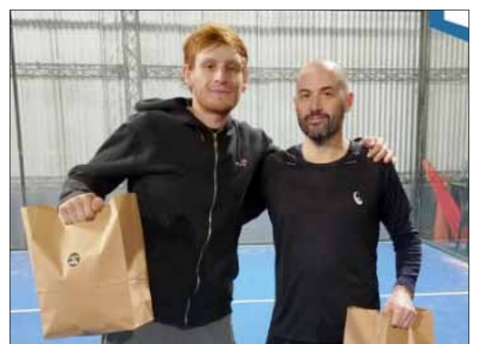
Aranas - Cestona, ganadores en Cuarta.