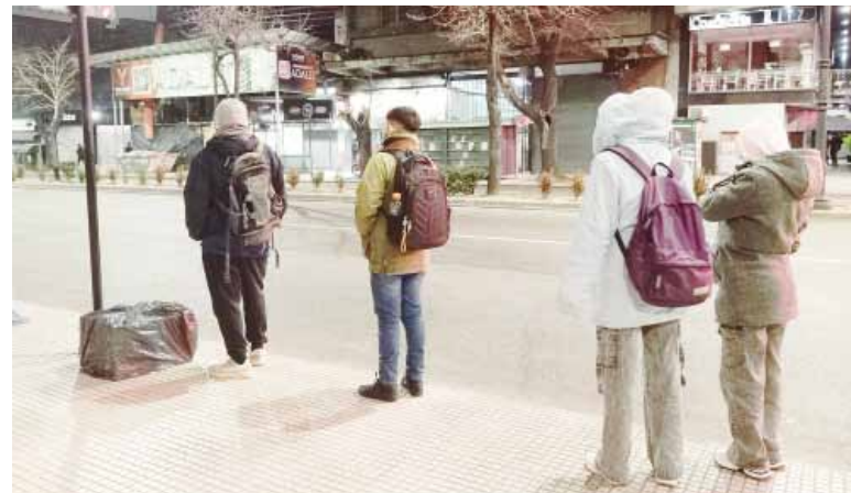
Alerta roja. Fue emitida para los municipios de 25 de Mayo, Chivilcoy, Alberti, Bragado, 9 de Julio y General Viamonte.

De acuerdo, al Sistema de Alerta Temprana (SAT) del SMN, en la provincia de Buenos Aires, los municipios de 25 de Mayo, Chivilcoy, Alberti, Bragado, 9 de Julio y General Viamonte, se encuentran bajo una alerta roja, que implica un