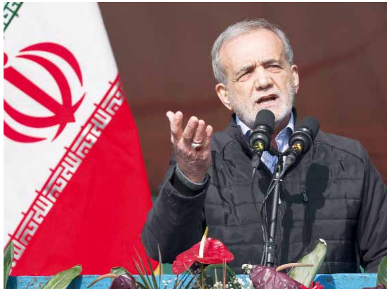
Faltan detalles. La orden de Masoud Pezeshkian no incluyó plazos ni detalles sobre lo que implicaría la suspensión.

peas que formaban parte del acuerdo nuclear de 2015 a implementar la cláusula que supondría la reanudación de todas las sanciones de Naciones Unidas suspendidas en su día debido al pacto alcanzado entre Teherán y las potencias mundiales, si una de las partes occidentales declara que la República Islámica lo está incumpliendo.