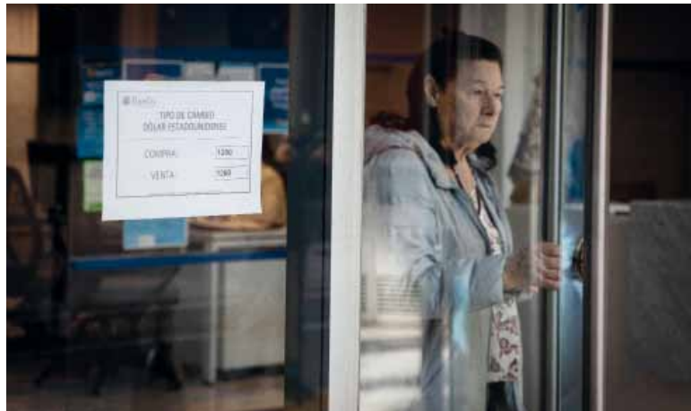
Movimiento. El dólar acumula una escalada de $ 40 en la semana.

Los analistas mencionan varios factores para explicar este fenómeno, que van desde la dolarización antes de las vacaciones de