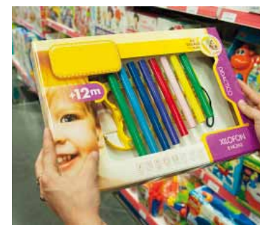
Día del Niño. Finalmente se mantendrá la fecha tradicional.

En mayo de 2025, las ventas en el rubro de los juguetes cayeron un 15% en unidades respecto al mismo mes del año anterior. La